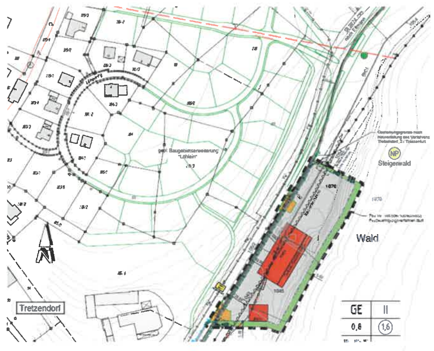
Geltungsbereich des Vorhabenbezogenen Bebauungsplans