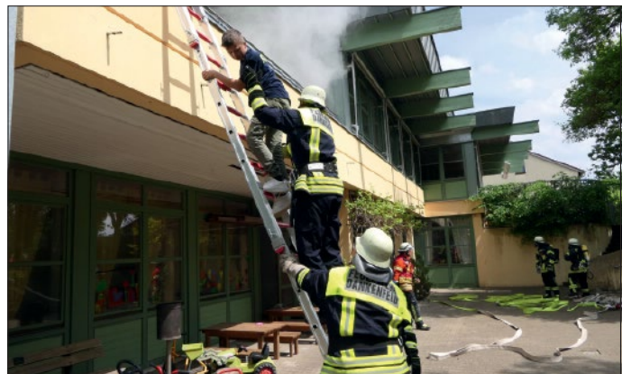
Unter anderem mit der Steckleiter wurden Kinder aus dem Obergeschoss des fiktiv brennenden Kindergartens gerettet.