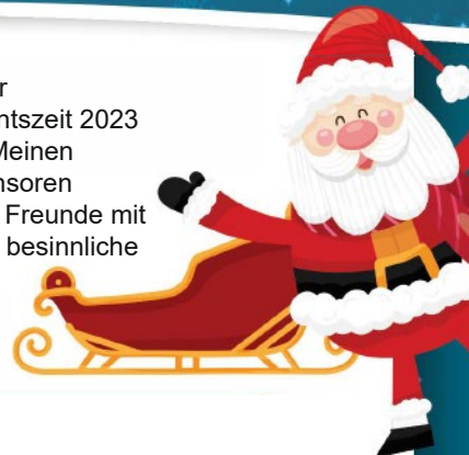
Thomas Sechser, Erster Bürgermeister

Es warten täglich interessante Gewinne und Gutscheine im Wert von jeweils 25,00 € - 50,00 € auf Sie.